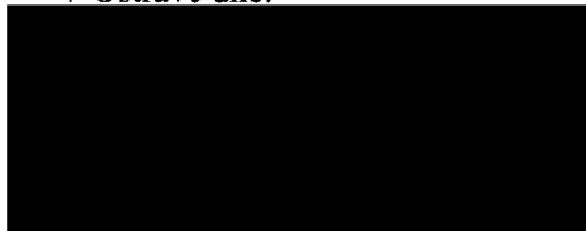
za zhotovitele Ing. Roman Fildán